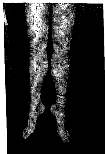
109 »Acht Kugeln in der Brust« 110 Verwandlungskünstler Jacques Mesrine